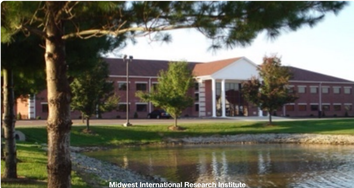
Midwest International Research Institute

* 제출 요청 서류 양식은 Midwest University 홈페이지( www.midwest.edu ) 의 J-1 Visa를 클릭하여 다운받으실 수 있습니다.